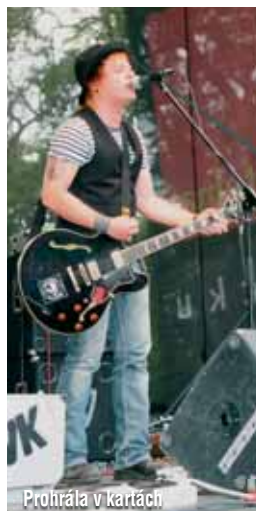
Prohrála v kartách