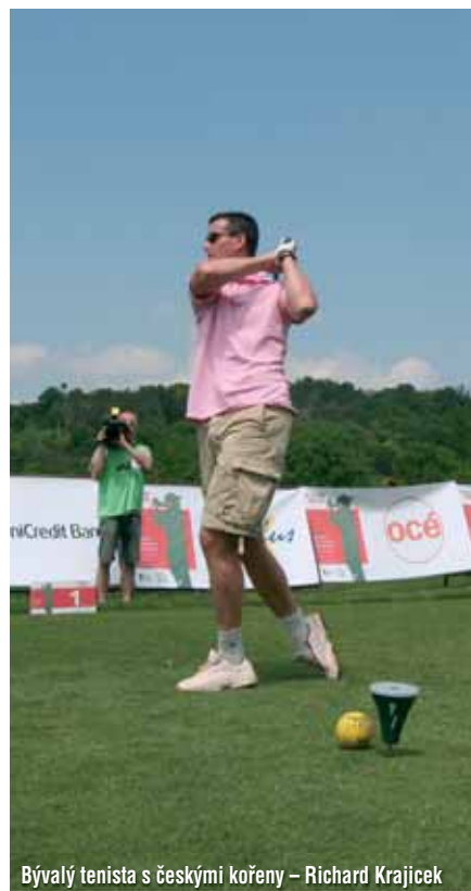
Bývalý tenista s českými kořeny – Richard Krajicek