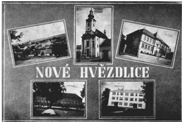
Pohlednice s nejvýznamnějšími budovami Nových Hvězdlic ze 40. let 20. století