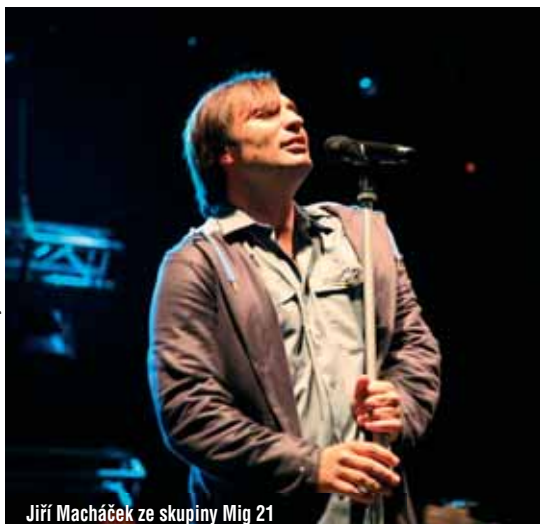
Jiří Macháček ze skupiny Mig 21