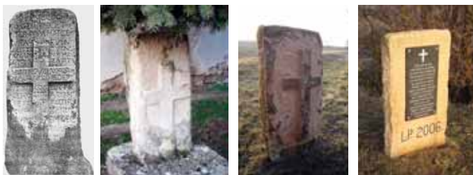
Zleva: původní kámen – 30. léta 20. stol. a současný stav; nový kámen – zadní strana s křížem, přední strana s nápisem.