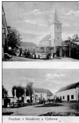
Nosálovce – dopisnice vydaná v r. 1907