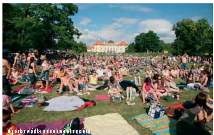
V parku vládla pohodová atmosféra