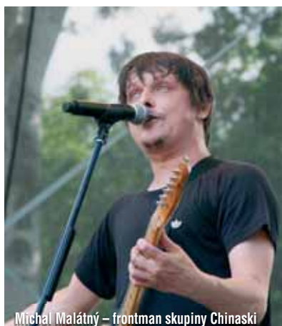
Michal Malátný – frontman skupiny Chinaski