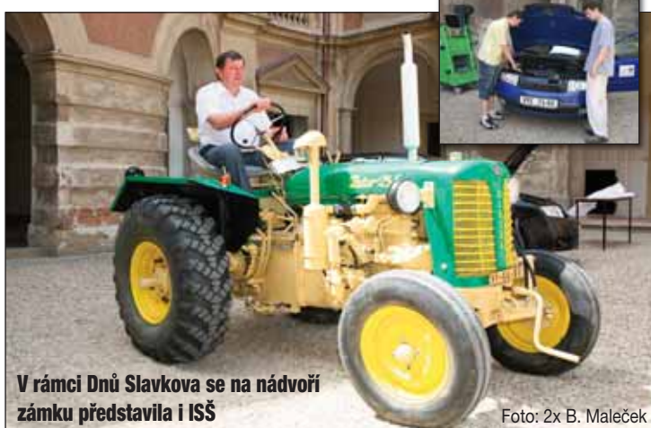
V rámci Dnů Slavkova se na nádvoří zámku představila i ISŠ

Mladému automechanikovi přejeme mnoho dalších úspěchů v moderním automobilním průmyslu. isš