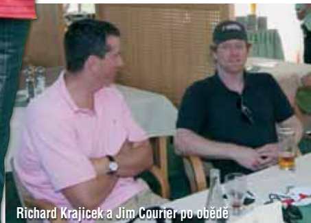
Richard Krajicek a Jim Courier po obědi