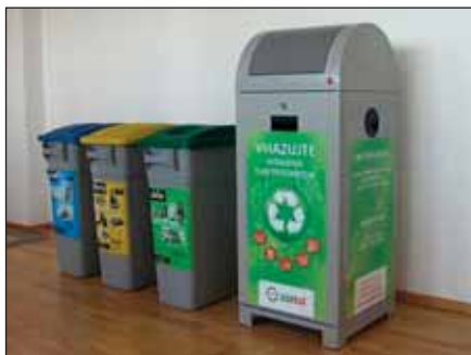
E-box sloužící pro ekologický a ekonomický sběr elektrozařízení.

Odbor životního prostředí oznamuje občanům, že v červenci vznikne nové sběrné místo pro odkládání vysloužilých malých elektrozařízení. Ve spolupráci se společnostmi ASEKOL a ECOBAT budou u hlavního vchodu na městském úřadě (budova pošty) umístěny tzv. E-boxy. Každý občan i firma může zanést starý mobil, kalkulačku, telefon, drobné počítačové vybavení, rádio, přehrávač apod. na obecní úřad a zdarma se jej zbavit vyhozením do připravené nádoby společnosti ASEKOL.