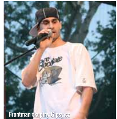
Frontman skupiny Gipsy.cz