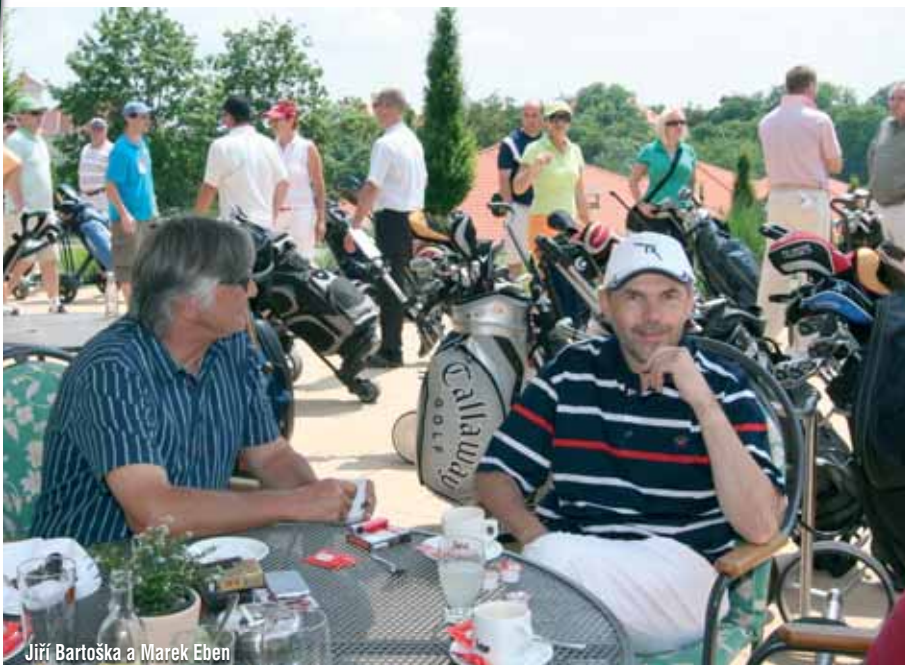
Jiří Bartoška a Marek Eben