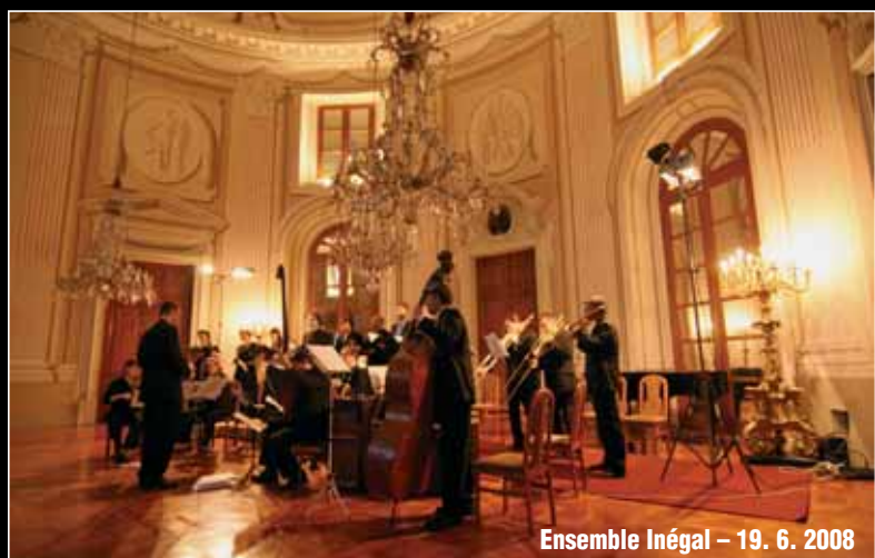
Ensemble Inégal – 19. 6. 2008