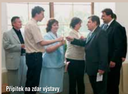
Přípitek na zdar výstavy