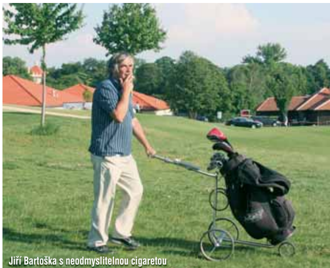
Jiří Bartoška s neodmyslitelnou cigaretou