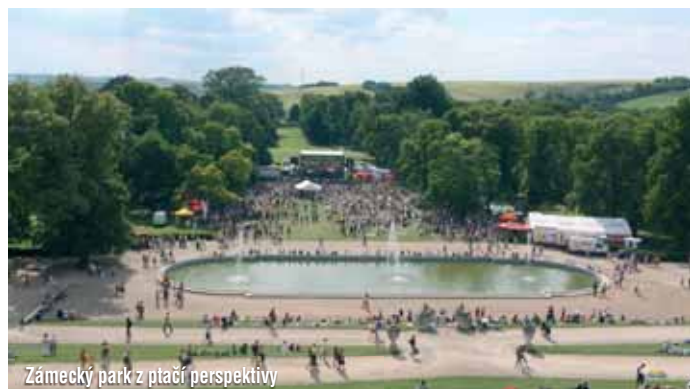
Zámeký park z ptačí perspektivy

v tomto roce. Večer zakončil velmi vtipně Jiří Macháček s kapelou MIG 21 a umožnil tak všem účastníkům, aby si s sebou odnesli jen ty nejpříjemnější zážitky. Hudebnímu publiku se také naskytl krásný pohled na slavkovský zámek, který celé události svrchu vévodil mezi fontánami všech zprovozněných bazénků. Škoda jen, že se občas vyskytly problémy se zvukem, které byly nejvíc zřetelné bohužel právě při vystoupení Hany Hegerové. red.